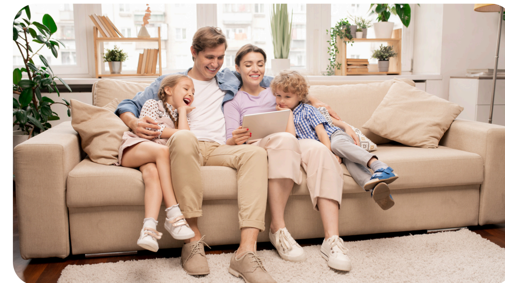
РАЗВИТИЕ ДУХОВНО- НРАВСТВЕННЫХ ЦЕННОСТЕЙ