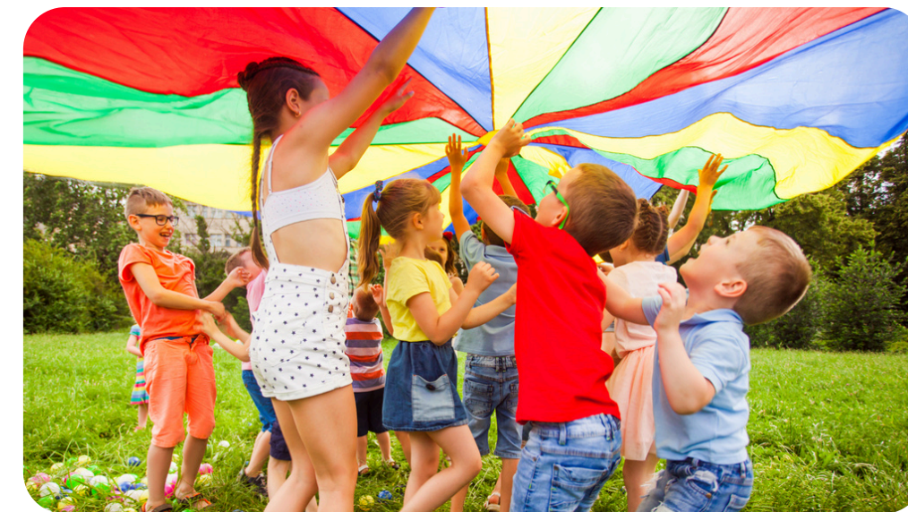
МНОГООБРАЗИЕ НАПРАВЛЕНИЙ ДЕЯТЕЛЬНОСТИ