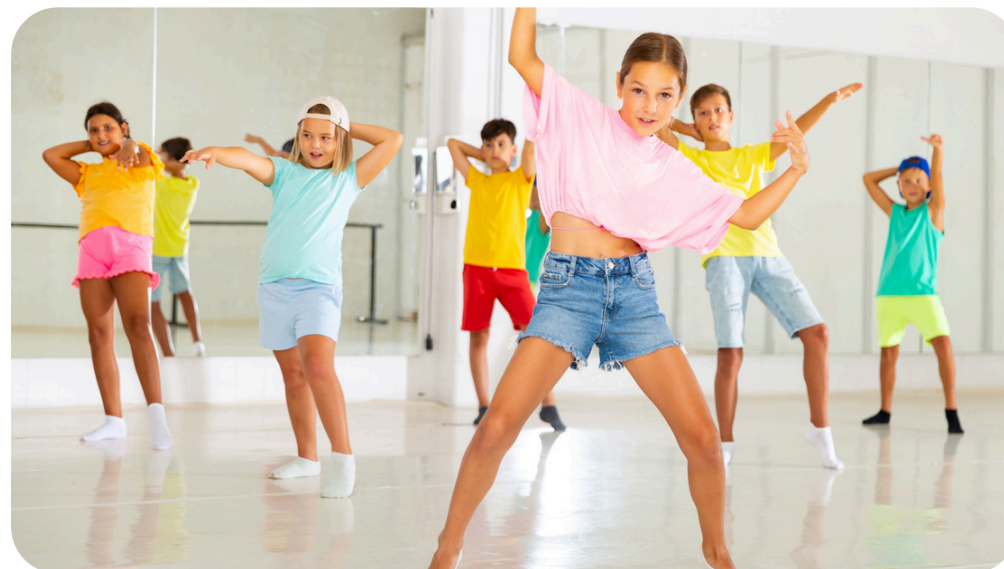
СВОБОДНЫЙ ВЫБОР ВИДА ДЕЯТЕЛЬНОСТИ